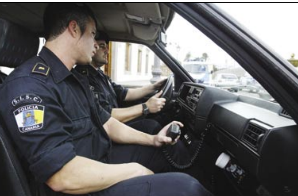
PATRULLA DEL GRUPO DE INTERVENCIÓN DE TELDE.

Las unidades especiales de intervención son también una parte del trabajo de las Policías locales en los municipios canarios. Dos de los primeros ayuntamientos que asumieron este reto fueron Arona y Telde. Allí la seguridad ciudadana se había convertido en algo más que en una declaración de intenciones y la Policía Local no podía estar fuera de esta problemática. No bastaba con organizar la plantilla y tener el mayor número de patrullas en la calle, sino de disponer de una respuesta rápida y eficaz a los focos conflictivos y, de paso, a través de la prevención, conseguir disminuir las estadísticas de criminalidad.