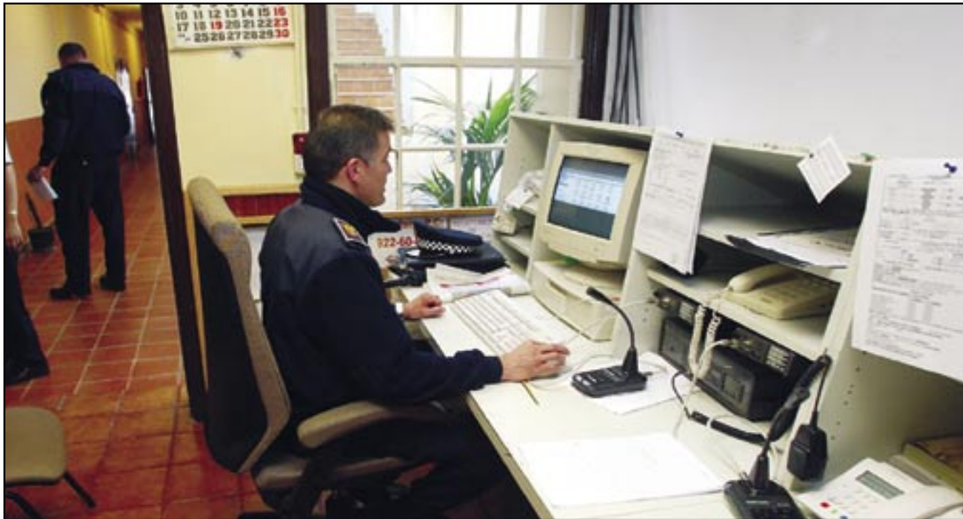
CENTRO DE CONTROL DE LA LAGUNA.

La labor policial es muchas veces criticada y denostada por muchos que ignoran la verdadera realidad a la que se enfrentan los agentes cada día. Para conocer mejor su trabajo, convivimos 24 horas con la Policía Local de La Laguna y descubrimos los entresijos de una labor que no siempre es valorada en su justa medida.