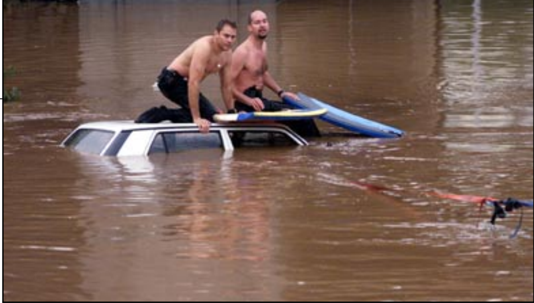
POLICÍAS LOCALES REALIZANDO LABORES DE RESCATE EL 31 DE MARZO DEL AÑO PASADO.

“Subimos a la Jefatura, nos cambiamos de ropa y nos marchamos a El Gramal. Nos comentaron que había un coche de Protección Civil inundado en el túnel y que junto a la persona que falleció, había una chica. Entramos amarrados a un camión con trinchas y empezamos la búsqueda. Al final, tras 45 minutos, encontramos el coche a la salida del túnel. Durante toda la tarde y la noche hubo muchísimas llamadas de personas que pedían ayuda porque se les inundaban sus casas y los compañeros se encargaron de solventar esos problemas