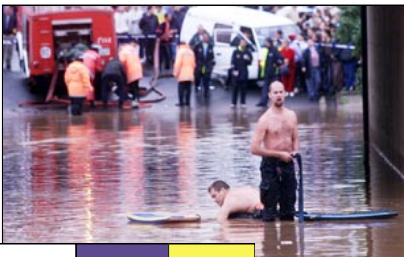
SERVICIOS DE SEGURIDAD ANTE LA EMERGENCIA.

desastre que había ocurrido. “Sobre las 5 de la madrugada, nos encontramos a dos personas que estaban manipulando un coche y pensábamos que era de su propiedad. Sin embargo, estaban robando este vehículo y se dieron a la fuga. Durante