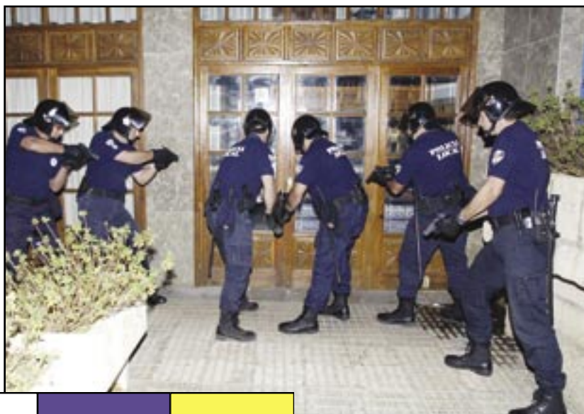
EJERCICIO SIMULADO DE INTERVENCIÓN EN LOCALES.

Esta unidad especial no huye de la colaboración con otras fuerzas de seguridad y con sus compañeros de Adeje mantiene unas excelentes relaciones, al igual que con el Cuerpo Nacional de Policía y la Guardia Civil. Este nivel de colaboración es fruto de los esfuerzos de la Jefatura que cuenta en este caso