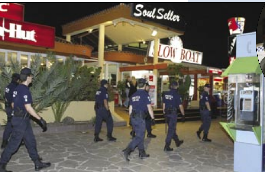
LA UPP DE ARONA.