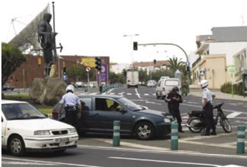
CONTROLES EN LA AVENIDA DE LOS MENCEYES.

encargan de medir y controlar el ruido, de las denuncias por animales domésticos (perros peligrosos) o la aparición de especies raras (han aparecido en Bajamar tortugas, lagartos, etc), vertidos de aguas fecales, quema de rastrojos, bosques y jardines, y, en general, todo lo relacionado con el medio ambiente.