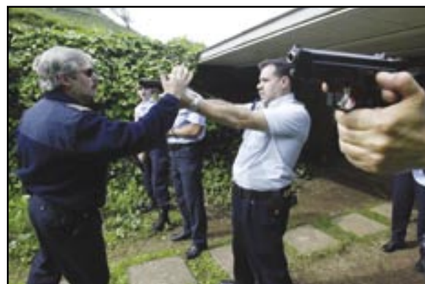
PRÁCTICAS DE TIRO POLICIAL.